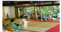
庭園茶席・生花展