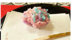
お茶席では抹茶と生菓子がいただけます。(有料)