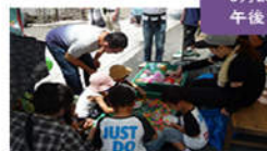
ヨーヨー釣りスーパースポーツすくい